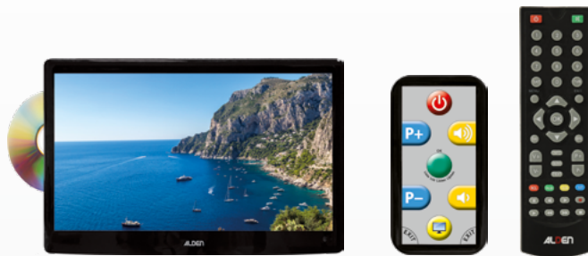
A.I.O.® HD CI+

Anleitung zum Update des A.I.O.® HD CI+ / Stand 26.09.2022