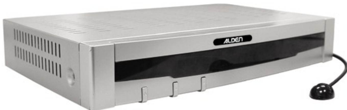
Gebrauchsmuster – außervertragliche Photos